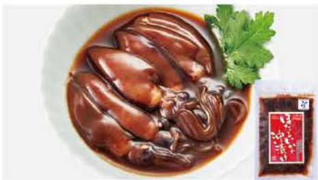
64 ほたるいか沖漬け 120g

国内(日本海など)で水揚げされた鮮度の良いすめいかを一夜干しにし、いかわたと和えて塩辛に仕上げました。原料のいかを乾燥させることで余分な水分を飛ばし、旨味を凝縮しています。麺を使用したまろやかな味わいです。