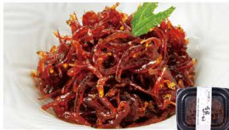
62 山椒ちりめん 40g

沖縄産のもずくを塩漬けせず生のまま冷凍。一般の塩もずくよりも歯ごたえが良く、シャキシャキとした食感が特長です。味付けされておりませんので、酢の物やサラダ、みそ汁など色々な料理にも。