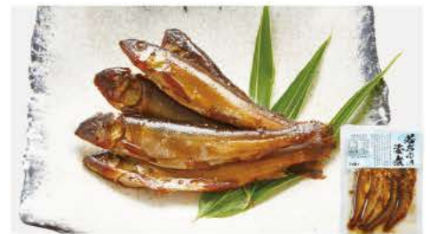
66 若あゆ姿煮 50g

大ぶりの数の子がたっぷり入った松前漬けです。北海道産がめ昆布とするめ入りで、漬け込みは醤油、米発酵調味料、てんさい糖などで仕上げました。