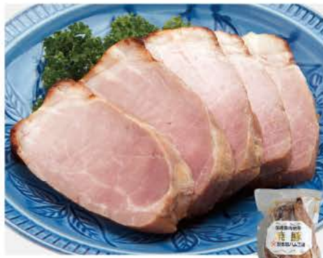
106 焼豚 200g

国産牛の内もも肉を使用して塩・こしょうをベースにじっくりとローストしました。肉の旨みを味わって頂けます。