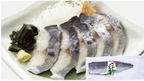
58 さわら昆布炙 1枚(130g)

昆布だしとゆずの風味を効かせ、程よい辛さの中に素材の旨みを活かしました。※重量管理しておりますので、明太子がカットされている場合がございます。