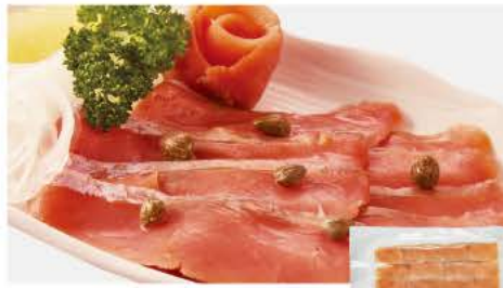
56 北海道産秋鮭 スモークサーモンスライス 100g

漁師厳選のかつおを、1本1本手焼きで丁寧に焼いていきます。わら焼きでない味わうことのできない香ばしい香りをお楽しみ下さい。※薬味・タレは付いておりません。※写真は調理例です。