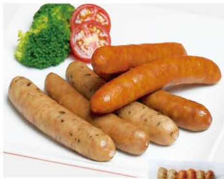
112 荒挽き ウインナー 3種各2本(120g)

平牧三元豚のもも肉を、昆布、椎茸などのダシを効かせて、じっくり漬け込みました。もも肉は赤身が多いのでよりさっぱりした味わいの生ハムです。