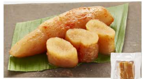
57 辛子明太子 80g

旬の時期に水揚げされた、脂のりの良い、北海道産秋鮭を、塩のみでシンプルに味付けし、ナラ、サクラの混合チップでじっくり燻煙しました。