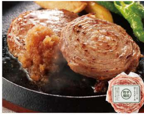
109 日本の米育ち三元豚 ロールステーキ 75g

植物性由来中心の飼料で育てた臭みのない国産鶏「ありたどり」の鶏肉を秘伝のタレに漬け込み丁寧に焼き上げました。中までタレがしみ込みジューシーな味わいです。