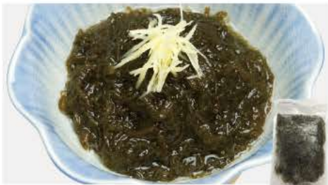
61 沖縄洗いもずく 100g

国産大豆を原料に消泡剤を使用せずに豆乳を作り、一つ一つ手で引き上げた生ゆばを棒状にし急速冷凍。大豆本来の豊かな風味をお楽しみ頂けます。刺し身としてそのままや、お好みでわさび醤油やめんつゆなどでも。