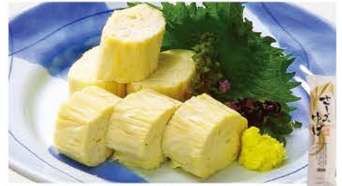
60 さしみゆば 120g

国産のさばを使用。程よく脂ののったさばを北海道産昆布と醸造酢、塩、砂糖で味付けし、まろやかな風味に仕上げました。