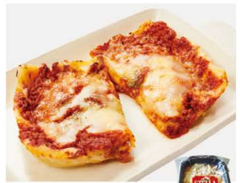
113 ラザニア ボロネーゼ 210g

国内産の豚肉を使い、無塩せきで仕上げたウインナー盛り合わせ。無塩せきとは亜硝酸塩等の発色剤を使用しない、肉本来の自然な色を活かした製法のことです。 Chorizo、ハーブ(バジル&パセリ)、プレーンの3種類。