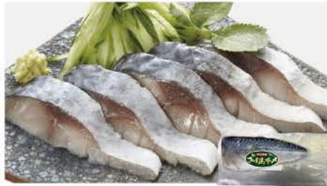
59 国産さば昆布炙 1枚(120g)

山口県産のさわらを使用。程よく脂ののったさわらを北海道産昆布と醸造酢、塩、砂糖で丁寧に味付けしました。さわらの旨みが引き立ちます。