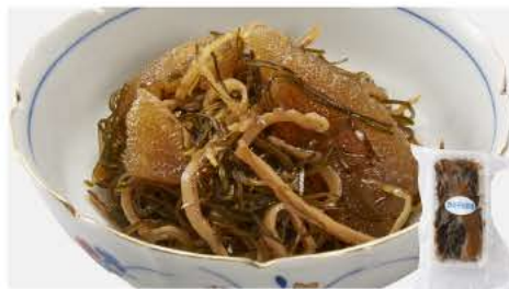
65 数の子松前漬け 200g

兵庫県浜坂産の一日漁で漁獲されたホタルイカをその日のうちに沖漬けに加工しました。最高の鮮度に仕上げるために目玉を取り除いておりません。