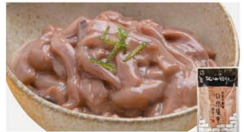
63 いか塩辛(翅入り) 100g

国産のちりめんにピリッとした風味の粒山椒を加えて、ごはんとの相性がよいちりめんの佃煮に仕上げました。