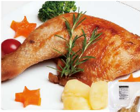
108 ローストレッグ 1本

国内産の豚ロース肉を使い、無塩せきで仕上げた特製ロースハム。無塩せきとは亜硝酸塩等の発色剤を使用しない、肉本来の自然な色を活かした製法のことです。