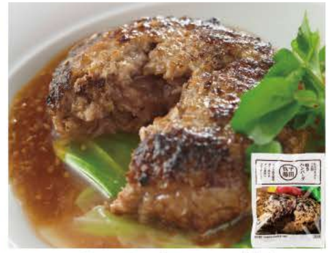
110 日本の米育ち三元豚 焼きハンバーグ 105g

平牧三元豚の肉をスライスしてロール状に巻いたステーキ。平牧三元豚の特長である柔らかい食感と上品な脂の旨みをそのままお楽しみ頂けます。