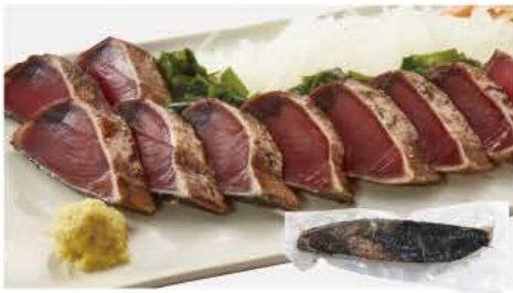
55 かつおわら焼きたたき 1節300g