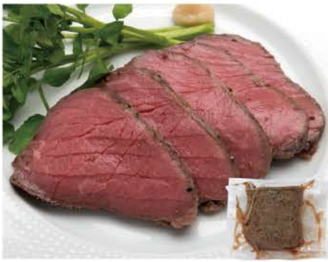
105 国産牛プレミアム ローストビーフ 300g