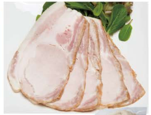
107 ロースハム 350g

国内産の豚もも肉を使い、タレに漬け込みじっくりと焼き上げた無塩せきの焼豚。無塩せきとは亜硝酸塩等の発色剤を使用しない、肉本来の自然な色を活かした製法のことです。