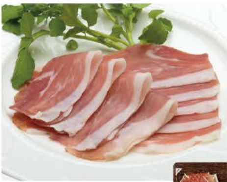
111 三元豚 極み生ハム 55g

平田牧場の純粋コラーゲン入り、平牧三元豚を使用したハンバーグ。冷凍のまま袋ごと湯煎するだけでジューシーで本格的なハンバーグがお楽しみ頂けます。お好みでソースなどをかけても。